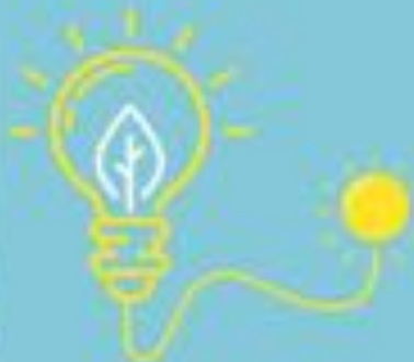
Capacitación en elaboración de Consomés de hierbas deshidratadas